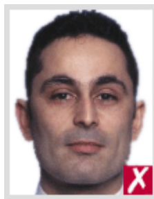
ไกลเกินไป