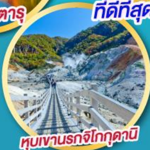
หุบเขานรกจิกุกุคานิ

พิเศษ ! บุฟเฟ่ต์ร้าน Nanda ที่ดีที่สุด ใน ซัปโปโร