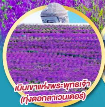
เป็นเขาแห่งพระพุทธรเจ้า (ทุ่งดอกลาเวนเดอร์)

บุฟเฟ่ต์เมลอนหอมหวานว่า กิจกรรมเก็บเชอร์รี่สดๆ จากต้น