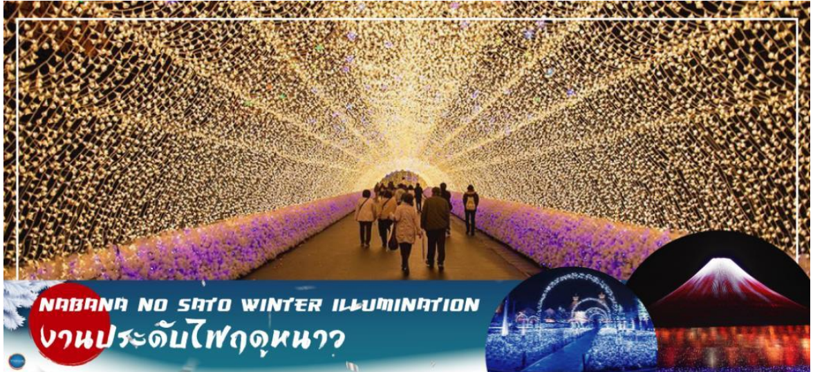
NABANA NO SATO WINTER ILLUMINATION งานประดับไฟฤดูหนาว

จากนั้นนำท่านชม งานประดับไฟฤดูหนาว ณ หมู่บ้านนาบะ โนะ ซาโตะ (Nabana no Sato Winter Illumination) เป็นธีมพาร์คสวนดอกไม้ ที่มีทุ่งดอกไม้ให้ชมตลอดทั้ง 4 ฤดูกาล สามารถเที่ยวได้ตลอดทั้งปี ไฮไลท์!!! การประดับไฟขนาดใหญ่ที่สุดในญี่ปุ่น จะมีในช่วงฤดูใบไม้ร่วงตลอดจนถึงปลายฤดูหนาว (ซึ่งในปีนี้เทศกาลไฟจัดถึงวันที่ 2 มิถุนายน 2567) จะได้รับความนิยมมากเป็นพิเศษ เนื่องจากมี การแสดงไฟในหลากหลายรูปแบบ ไม่ว่าจะเป็น อุโมงค์แสงไฟ (Tunnel of