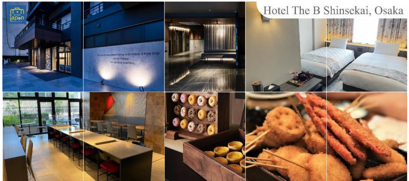
Hotel The B Shinsekai, Osaka

พักที่ HOTEL THE B SHINSEKAI, OSAKA หรือเทียบเท่าระดับเดียวกัน