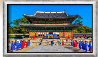
พระราชวังชางด็อกกุง