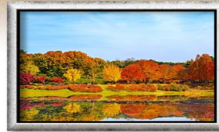
โอลิมปิกพาร์ค