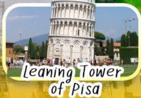
Leaning Tower of Pisa