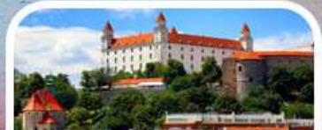
Bratislava Castle Courtyard