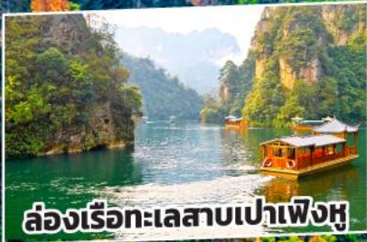
ล่องเรือทะเลสาบเป่าเฟิ่งหู