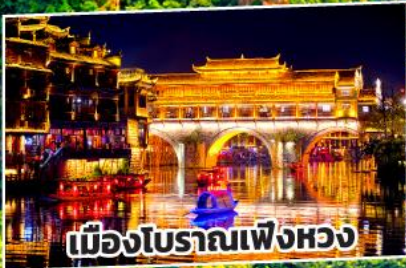
เมืองโบราณเฟิ่งหวง