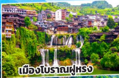
เมืองโบราณฝูหรง