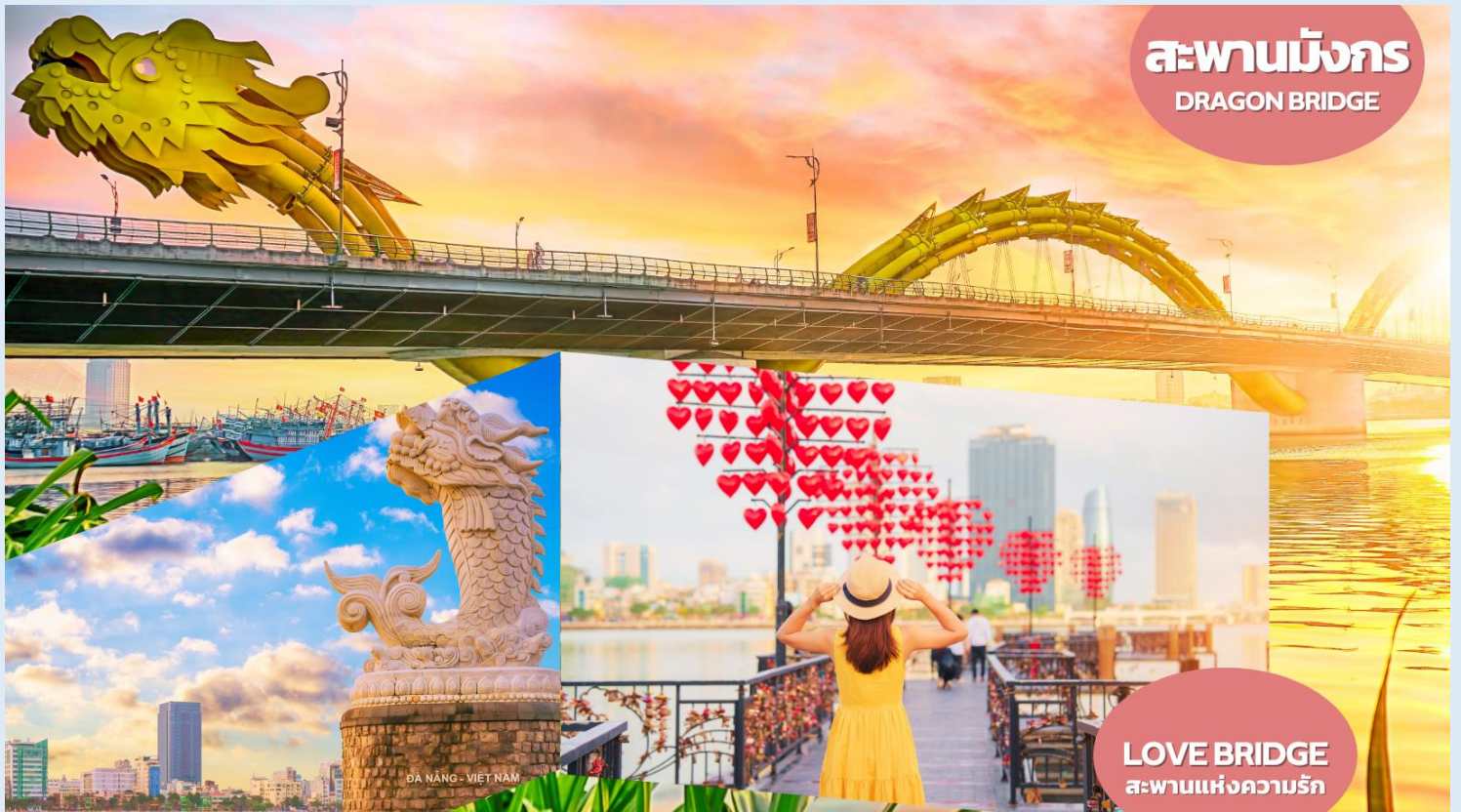
สะพานมังกร DRAGON BRIDGE

พาทชมหาดหมีเคว (My Khe Beach) ชายหาดที่สวยงามที่สุดในเมืองดานัง มีแนวโค้งตามลักษณะภูมิประเทศของเวียดนามซึ่งยาวกว่า 32 กิโลเมตร มีหาดทรายสีขาวและเม็ดทรายละเอียด น้ำทะเลสีฟ้าใส ท่านจะได้เพลิดเพลินไปกับธรรมชาติที่สวยงามทั้งวิวภูเขาและอ่าวที่อยู่ตรงข้าม อิสระถ่ายรูปเช็คอินตามอัธยาศัย