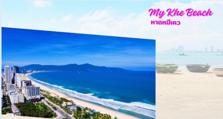
My Khe Beach หาดหมีเคว

นำท่านเดินทางกลับสู่เมืองดานัง ระหว่างทาง นำท่านแวะ ร้านเยื่อไผ่ ซึ่งเป็นร้านขายผลิตภัณฑ์ที่ทำมาจากเยื่อไผ่ ที่มีคุณสมบัติในการขับน้ำ ขับกลิ่น ได้เป็นอย่างดี โดยสินค้าที่น่าสนใจมี ครีมย้อมผมธรรมชาติจากถ่านไผ่ ชุดชั้นในจากเยื่อไผ่ หมวกคลุมขับน้ำ และ แผ่นรัดบรรเทาอาการปวดเมื่อย เป็นต้น