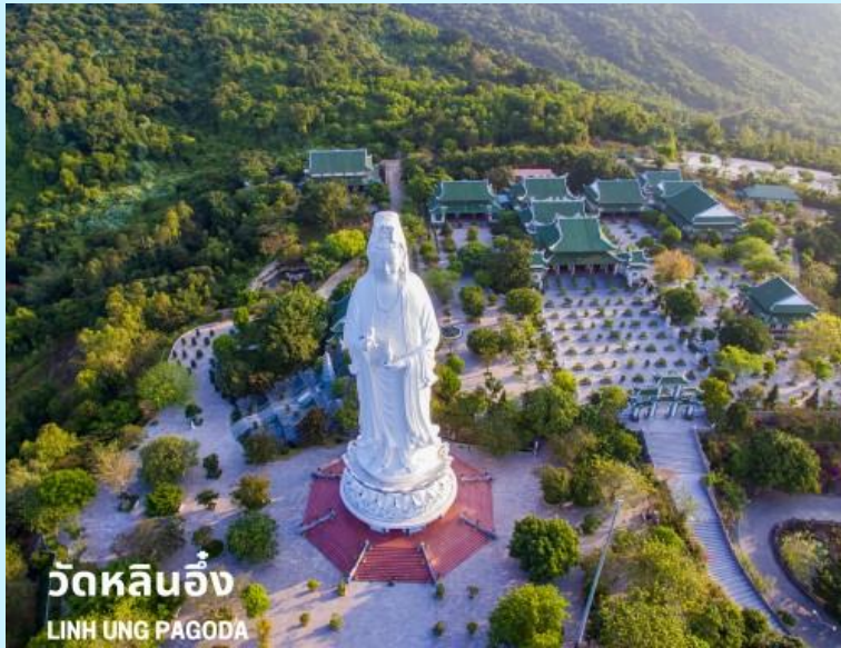
วัดหลินอึ้ง LINH UNG PAGODA

จากนั้นนำท่านแวะร้านไข่มุก (สามสมบัติ) อิสระเลือกซื้อผลิตภัณฑ์ที่ทำมาจากไข่มุก เช่น สร้อย แหวน ต่างหู เป็นต้น