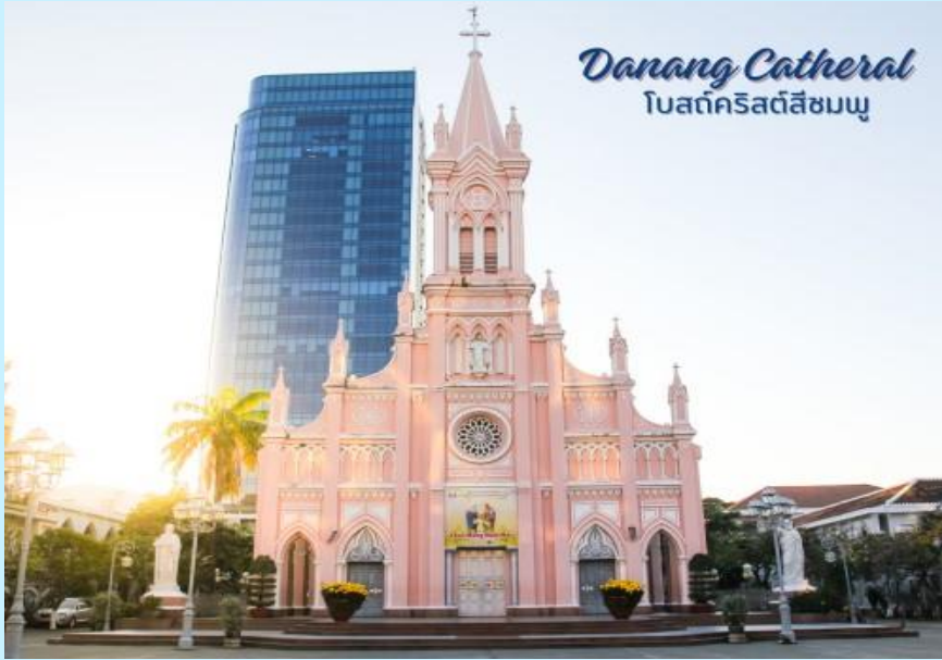
Danang Cathedral โบสถ์คริสต์สีชมพู

นำท่านถ่ายรูป โบสถ์คริสต์ดานัง หรือโบสถ์คริสต์สีชมพู (Danang Cathedral) สร้างขึ้นสมัยเวียดนาม ตกเป็นอาณานิคมของฝรั่งเศส สถาปัตยกรรมสไตล์โกธิก ยตกแต่งด้วยความประณีตสวยงาม ตัวโบสถ์เป็นสีชมพูทั้งหลัง ตัดขอบด้วยสีขาว เป็นอีกหนึ่งสถานที่ที่ไม่ควรต้องพลาดเมื่อมาเยือนเมืองดานัง จากนั้น อิสระช้อปปิ้ง ตลาดฮาน อิสระเลือกซื้อสินค้าหลากหลายชนิด เช่นผ้า เหล้า บุหรี่ และของกินต่างๆ เป็นตลาดสดและขายสินค้าพื้นเมืองของเมืองดานัง