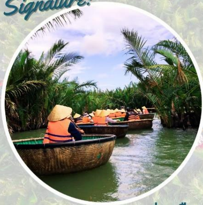
ล่องเรือกระด้ง