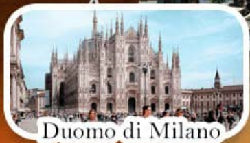
Duomo di Milano