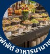
บุฟเฟ่ต์ อาหารนานาชาติ