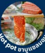
Hot pot ชาบูแซลมอน