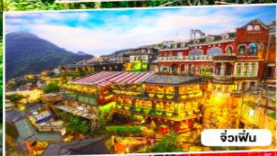
จิวเฟิ่น