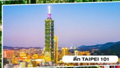
ตึก TAIPEI 101