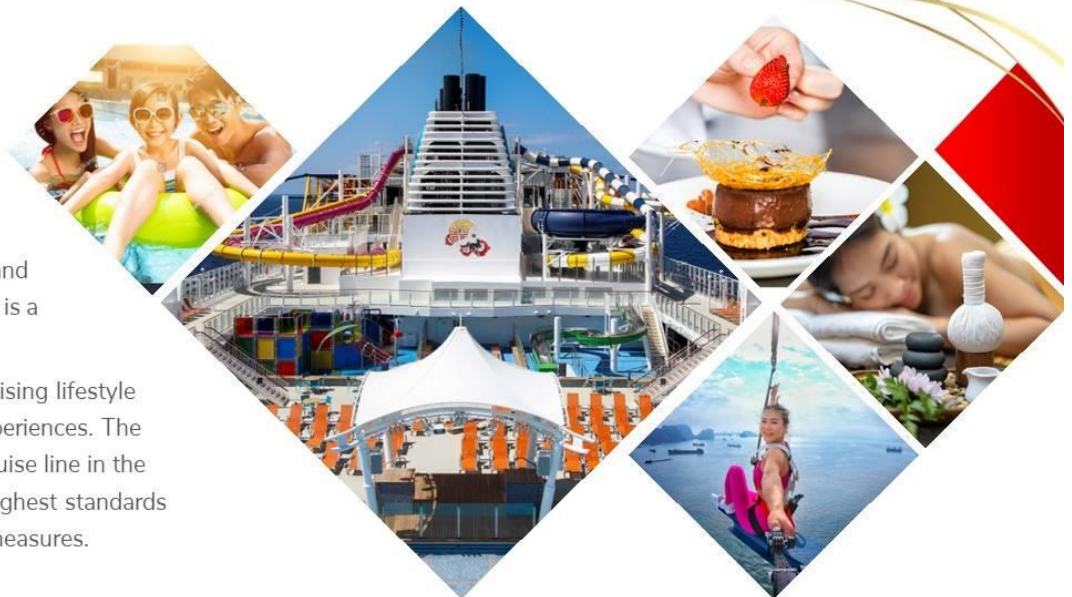
Resorts World Cruises 1

We offers a personalized cruising lifestyle with diverse international experiences. The brand aims to be a leading cruise line in the Asian region, providing the highest standards in safety and precautionary measures.