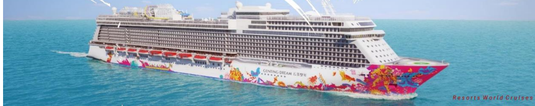
Resorts World Cruises 1

*** ก่อนเวลาเรือสำราญออกจากท่าขอเชิญทุกท่านร่วมกิจกรรมซ้อมจุดรวมพลกรณีฉุกเฉิน 'Muster Drill' ซึ่งเป็นหนึ่งในกฎการเดินเรือสากลโดยเมื่อมีประกาศจากทางเรือให้ทุกท่านไปยังจุดรวมพลตามที่กำหนดไว้บนบัตรขึ้นเรือ (SeaPass) ของท่าน***