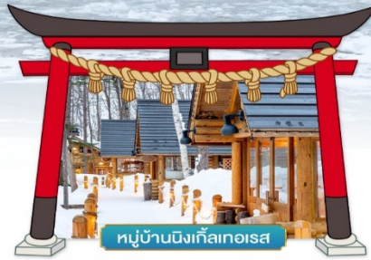
หมู่บ้านนิงเกิลเทอเรส