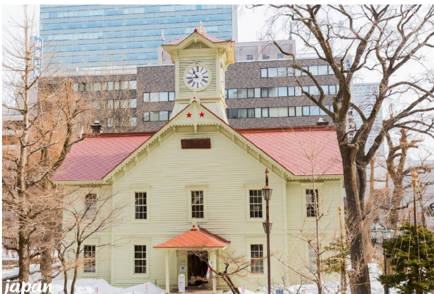
นักท่องเที่ยวที่สนใจได้เข้าชม

อิสระให้ท่านท่องเที่ยวชมเมืองซัปโปโรตามอัธยาศัย ไม่รวมค่าบริการรถรับส่งและค่าเข้าชมสถานที่ต่างๆ โดยภายในเมืองซัปโปโรมีสถานที่ท่องเที่ยวอื่นๆที่น่าสนใจดังนี้ โดยวันอิสระมีไกด์บริการแนะนำให้ข้อมูลวิธีการเดินทาง