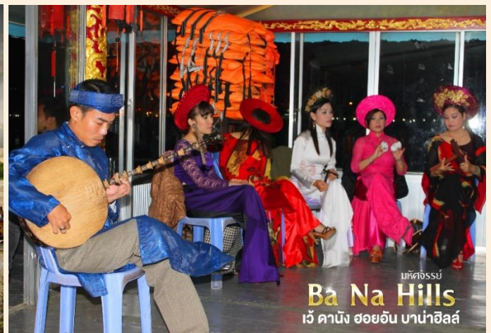
มหิตจรรย์ Ba Na Hills เว้ ดานัง ฮอยอัน บาน่าฮิลล์

📍 จากนั้น พักที่ Thanh Lich Hotel หรือเทียบเท่าระดับ 3 ดาว** ของมาตรฐานเวียดนาม