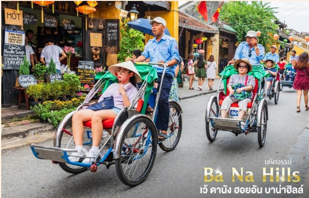
มหิตจรรย์ Ba Na Hills เว้ ดานัง ฮอยอัน บาน่าฮิลล์

(ไม่รวมค่าทิปคนขี่สามล้อ ท่านละ 40 บาท/ต่อท่าน/ต่อทริป)