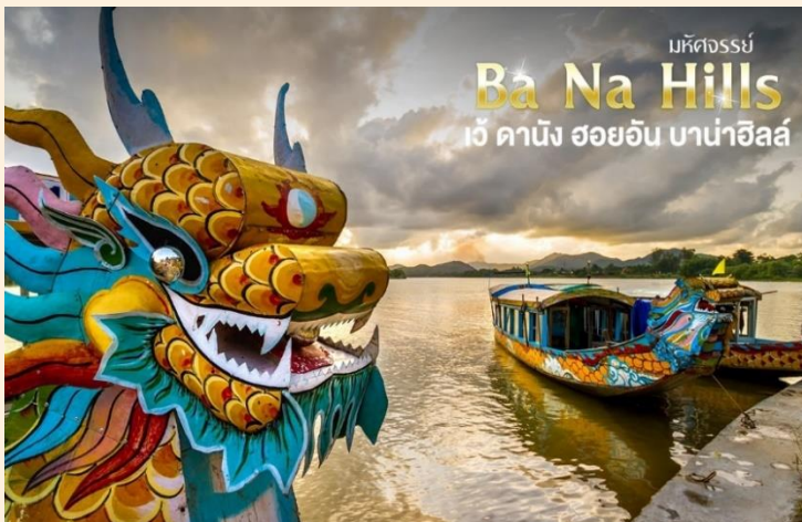
มหิตจรรย์ Ba Na Hills เว้ ดานัง ฮอยอัน บาน่าฮิลล์

นำท่าน ลงเรือมังกรล่องแม่น้ำหอม พร้อมชมการแสดงและดนตรีพื้นเมือง