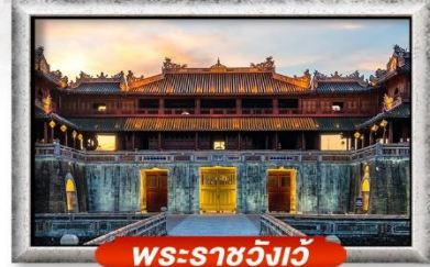
พระราชวังเว้