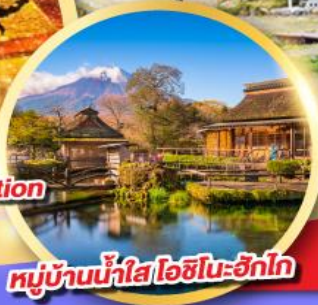
หมู่บ้านน้ำใส โอชิโนะอิกุ