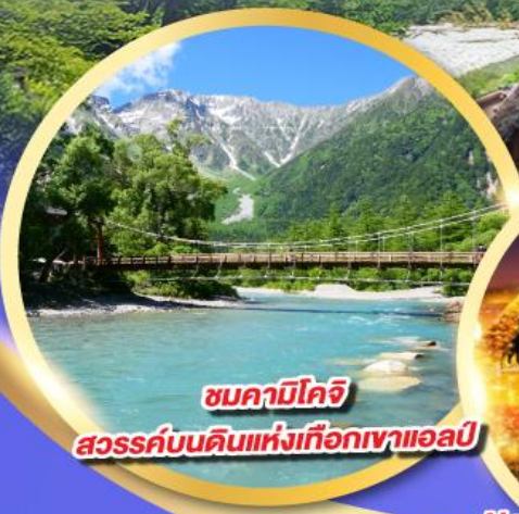
ชมคามิโคจิ

นั่งรถเข้าลอยฟ้า 2 ชั้น ชินโฮทากะ หนึ่งเดียวในญี่ปุ่น แลนด์มาร์กยอดฮิตของโอคุซิดะ