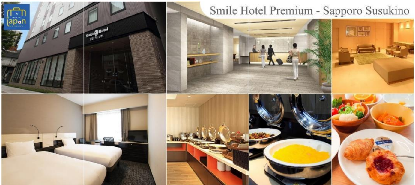
Smile Hotel Premium - Sapporo Susukino