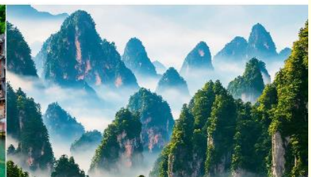
เขาเทียนชื้อซาน