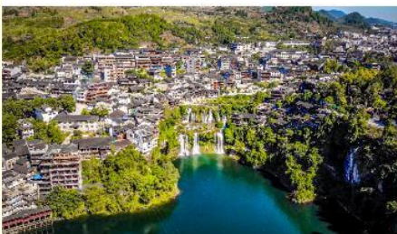
ฝูหรงเจิน