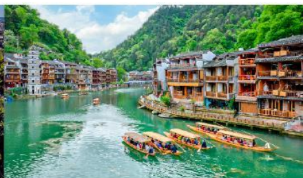
เมืองเฟิ่งหวง