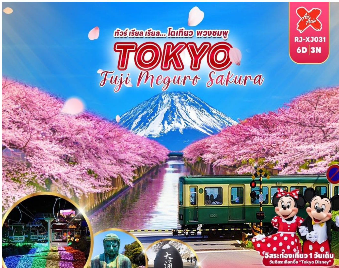
งานไฟซากามิโกะ อัลลุมินิเยน