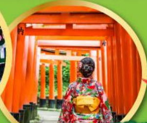
ศาลเจ้าฟูชิมิ อินาริ