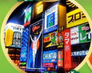
ช้อปปิ้งโอซาก้า