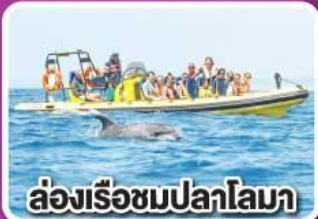
ล่องเรือชมปลาโลมา