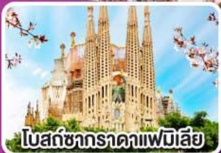
โบสถ์ซากราดาแฟมิเลีย