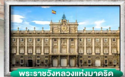
พระราชวังหลวงแห่งมาดริด