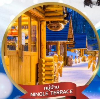
หมู่บ้าน NINGLE TERRACE

พักอาซาฮิคาว่า 1 คืน • โอตารุ 1 คืน • ขับไปโร 2 คืน