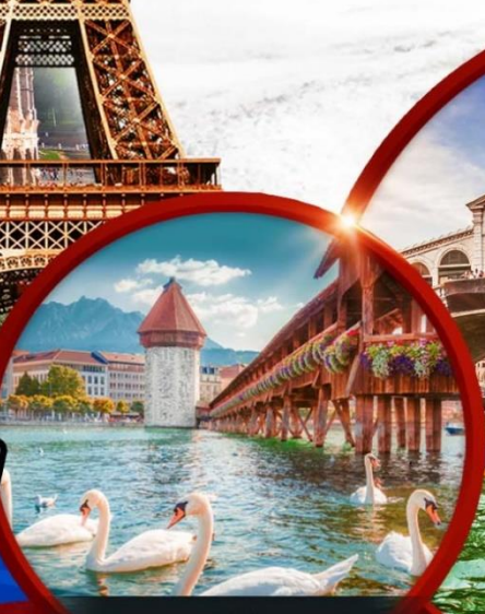
สะพานไม้ ชาเปล

รวมทุกอย่าง!! ไม่ต้องจ่ายหน้างาน วีซ่า ทิปท้องถิ่น ตัวประกันโรงแรม หัวหน้าทัวร์