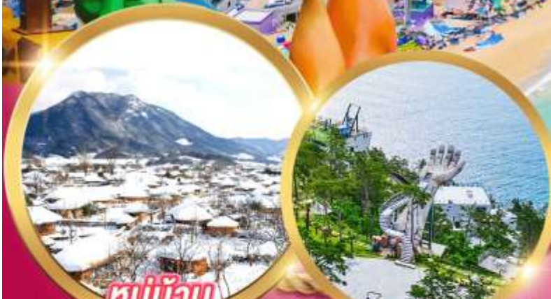
หมู่บ้าน นากาอึบซอง