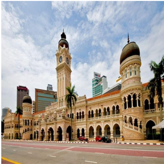
ฉลองเอกราชพันจากประเทศในเครื่องจักรภาพ

ฮินดู ด้านหน้าปากทางขึ้นบันไดไปยังถ้ำ ช้างบนมีรูปปั้นของพระซันท์ กุมารสูงถึง 42.7 เมตร