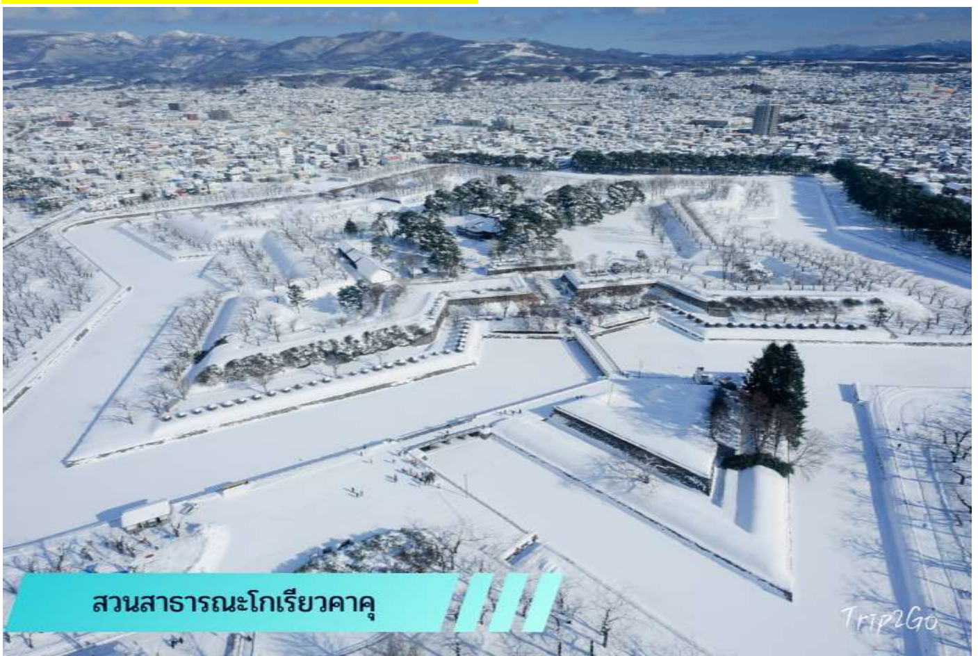
สวนสาธารณะโกเรียวคาคุ

เที่ยง 10/ บริการอาหารเที่ยง ณ ภัตตาคาร (4)