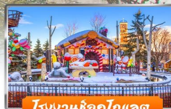
โรงงานช็อกโกแลต