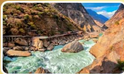
ช่องแคบเสือกะโจน