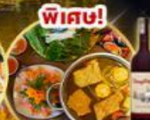
ชาบูปลาหมอน หม้อไฟปลาสดอร่อยชม * ไร่ดาดลิ้น