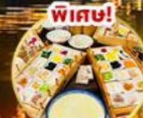
เมนูถ้วยเต๋อซิว ข้ามสะพาน