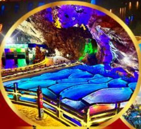
ด้านกนางแอน