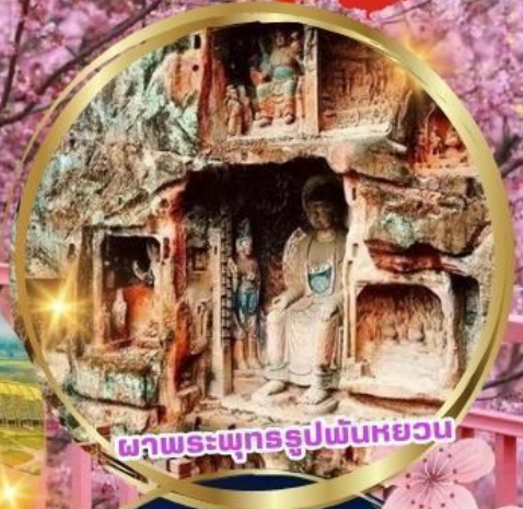
ผาพระพุทธรูปพันหยวน