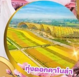
ทุ่งดอกคาโนล่า