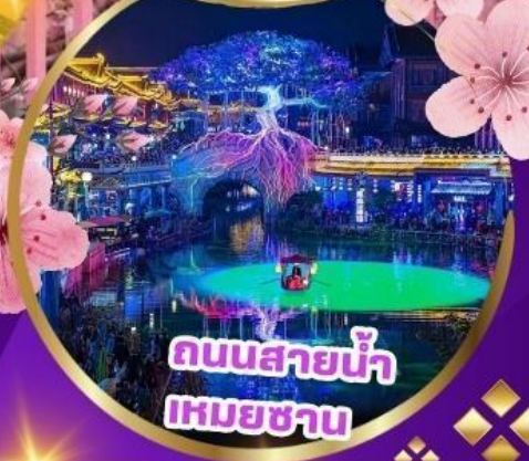
ถนนสายน้ำ เหมยซาน