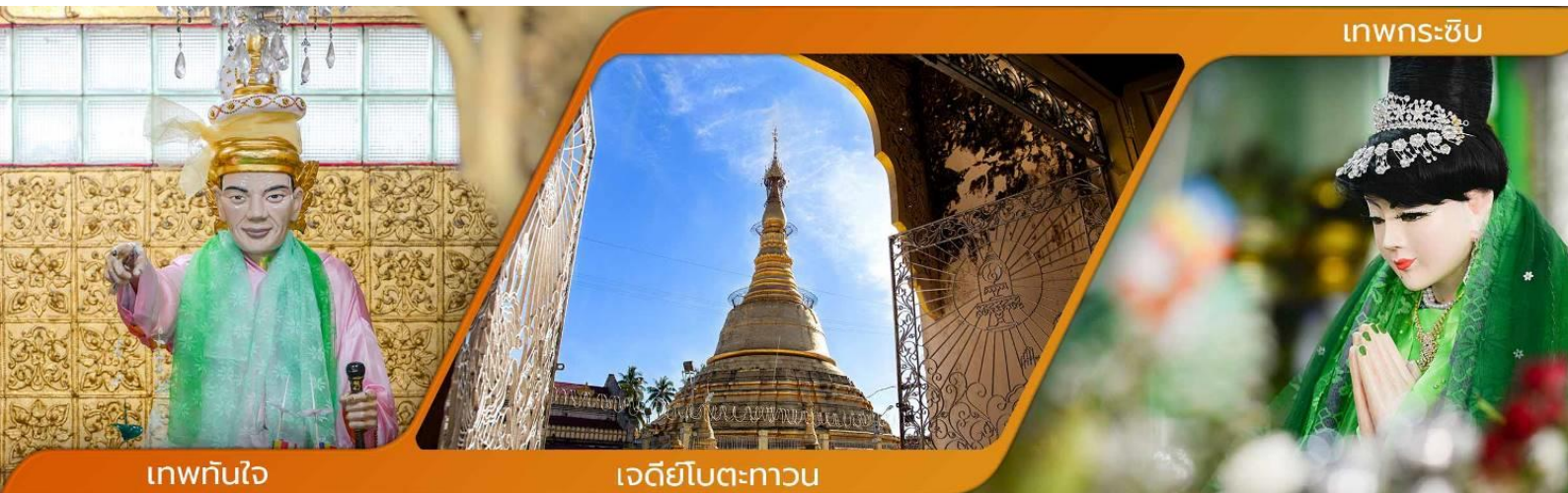
เทพกระซิบ

คำบูชาเทพทันใจ เอหิ สักกะ มหามันโทปิระปิระจีโปตะถ่องสิทธิมัตถุ อิทังพะลัง เอตัสสะมิงรัตตะนัง พุทธัง อัมมัง สังฆัง เทวานัง ประสิทธิลาโภ ขยโยนิจัจจัน วันทามิสัพพะทา สวาโหม