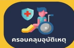
ครอบคลุมอุบัติเหตุ