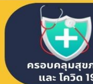
ครอบคลุมสุขภาพ และ โควิด 19