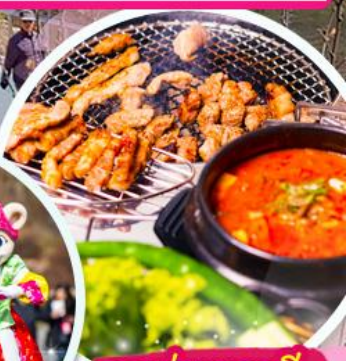
เมนูย่างเกาหลี