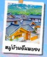
หมู่บ้านอินพยอง