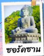
ชอรัคซาน