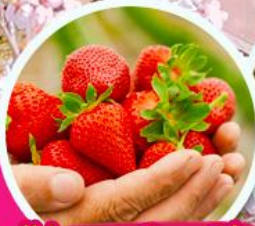
ไร้สตรอว์เบอร์รี่