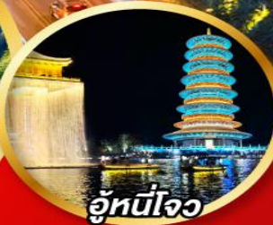
อุ๋หนี่โจว