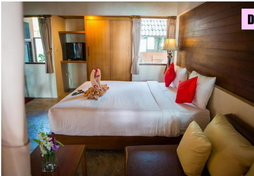
Deluxe Garden Bungalow