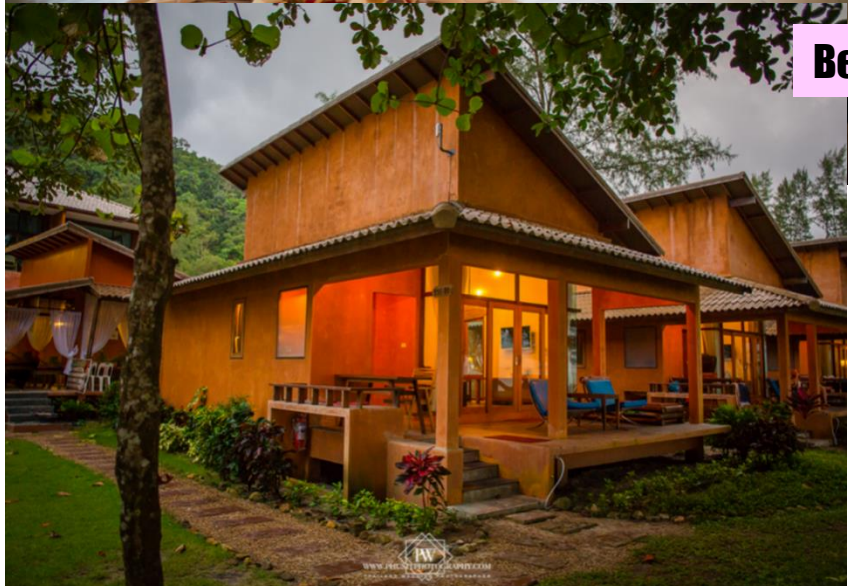
Beach Front Villa