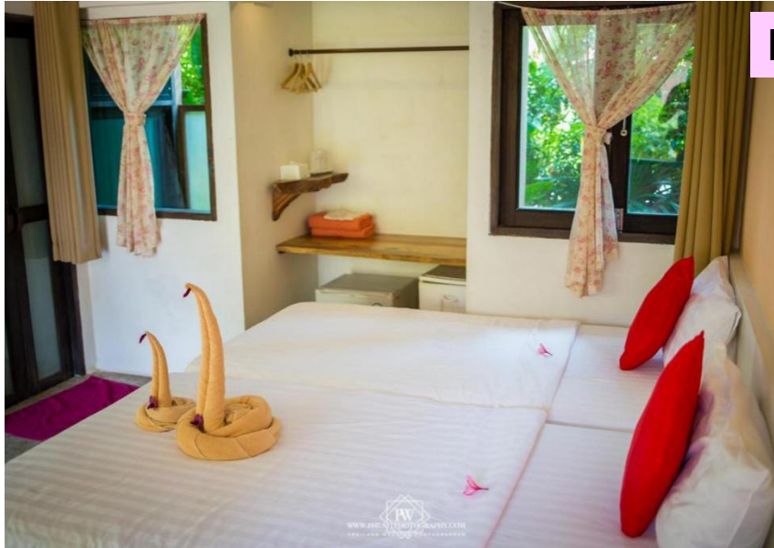
Back Garden Bungalow