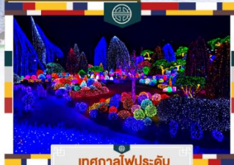
เทศกาลไฟประดับ