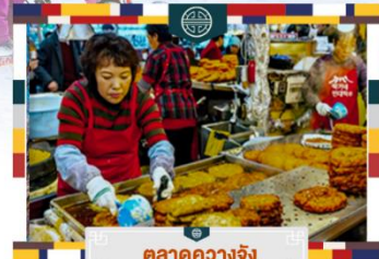
ตลาดควางจิง