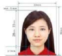
3.5cm x 4.5cm Paper Photo for Visa Application Form