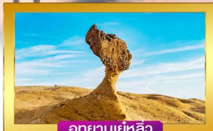
อุทยานเยลโลว์