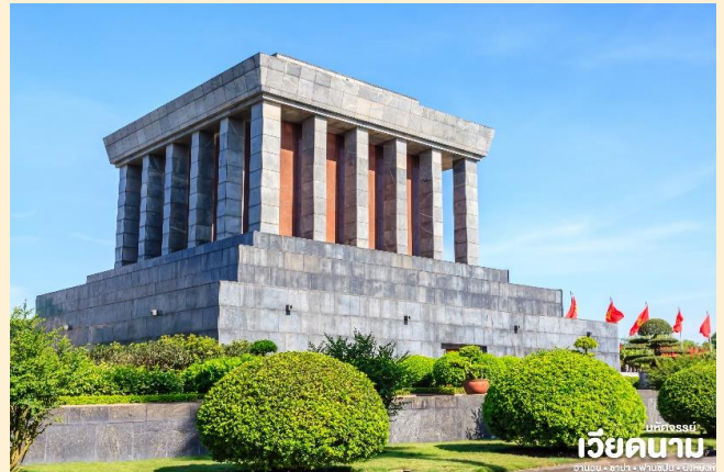
เวียดนาม

ชม จัตุรัสบาดีญ เป็นจัตุรัสที่มีชื่อเสียงของกรุงฮานอย ซึ่งมีความสำคัญทางประวัติศาสตร์คือประธานาธิบดีคนแรกของเวียดนามได้มาอ่านคำประกาศอิสรภาพ ณ ที่แห่งนี้ เมื่อวันที่ 2 กันยายน 1945 หลังสงครามโลกครั้งที่สอง และเป็นที่ตั้งของทำเนียบและกระทรวงต่างๆ รวมถึงอนุสรณ์สถานโฮจิมินห์อีกด้วย นำท่านชม โบสถ์ฮานอย เป็นสถานที่สำคัญอีกแห่งหนึ่งของเวียดนาม