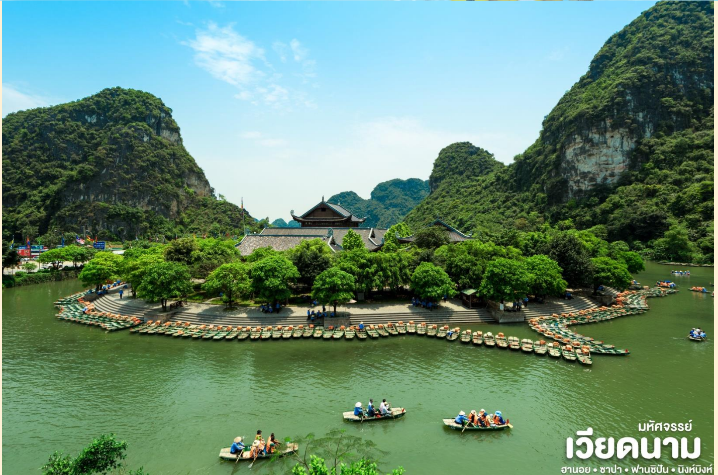
มหัสจรรย์ เวียดนาม ฮานอย • ซาปา • ฟานซีปัน • นิงห์ฮิงห์