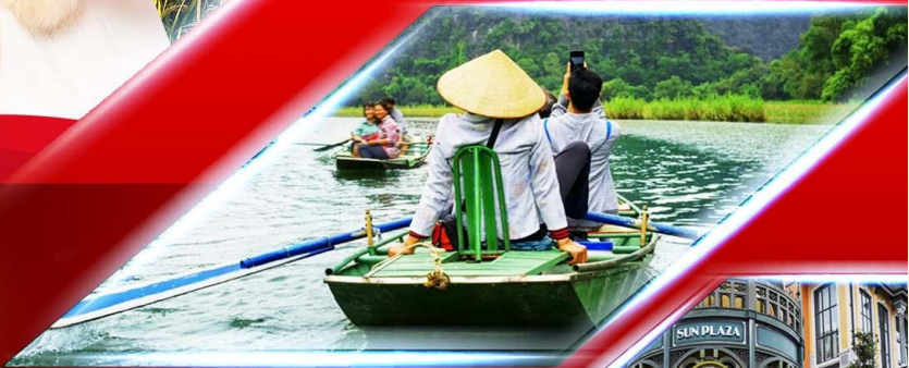
ล่องเรือ นิงห์บิงห์