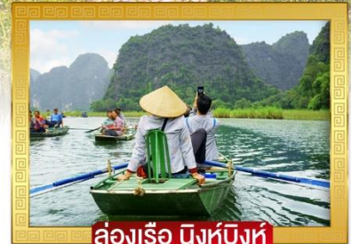
ล่องเรือ นิงห์บิงห์