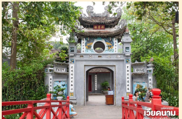
มัทศจรรย์ เวียดนาม ฮานอย • ซาปา • ฟานซิง • นิงห์ฮิงห์