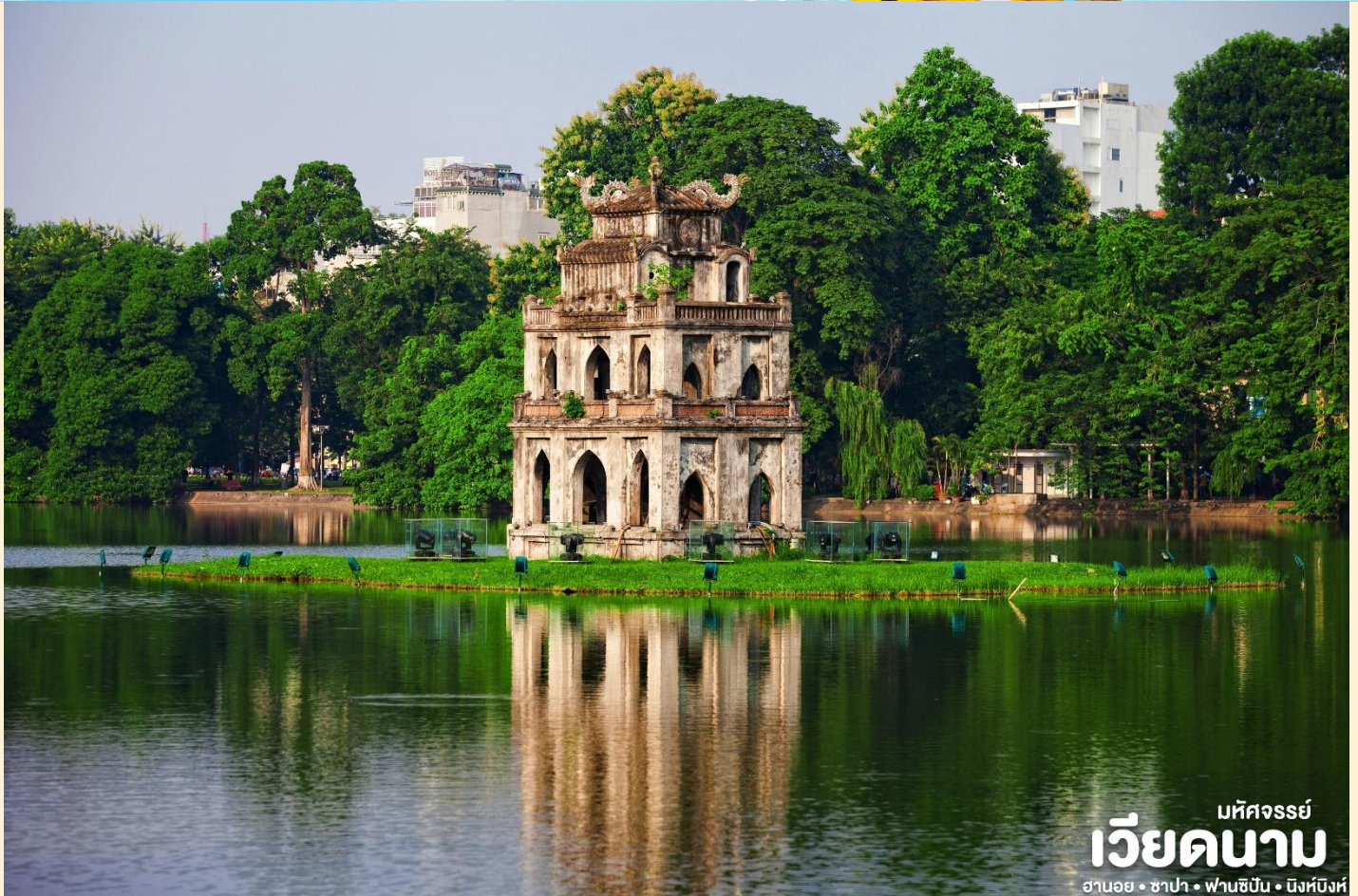
มัทศจรรย์ เวียดนาม ฮานอย • ซาปา • ฟานซิง • นิงห์ฮิงห์