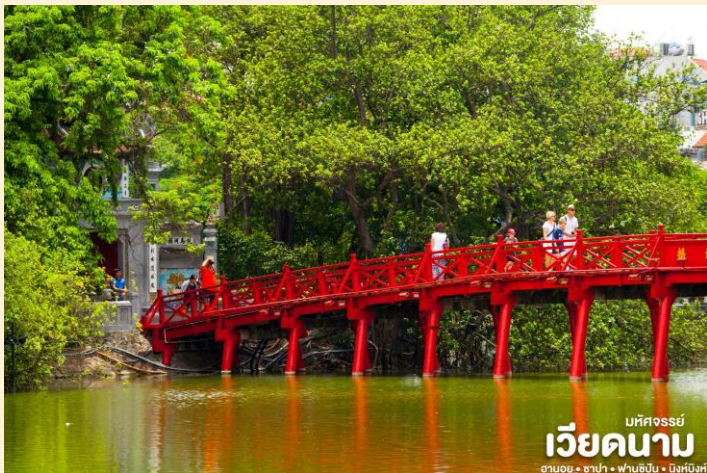
มัทศจรรย์ เวียดนาม ฮานอย • ซาปา • ฟานซิง • นิงห์ฮิงห์