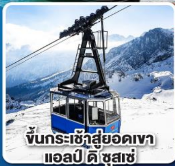
ขึ้นกระเช้าสู่ยอดเขา แอลป์ ดิซุสแซ่

เที่ยวเมืองอินส์บรุค เพชรเม็ดงามสุดโรแมนติก แห่งแคว้นทิโรล ราคาเริ่มต้น