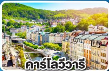
คาร์ลสบาด