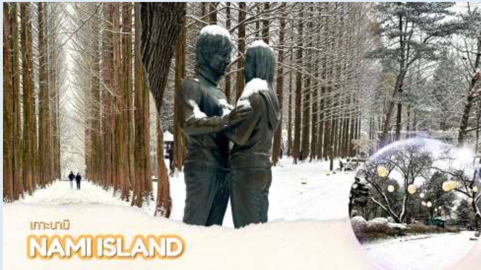
เกาะนามิ NAMI ISLAND

เที่ยง บริการอาหารเที่ยง ณ ร้านอาหาร (มื้อที่ 1) บริการ ตัดคาลบี้ หรือไก่บาร์บีคิวผัดซอสเกาหลีอาหารเลี้ยงเชื้อของเมืองซุนซอน โดยนำไก่บาร์บีคิว มันหวาน ผัดกะหล่ำปลี ต้นกระเทียม ต็อกหรือข้าวปั้น และซอสมาผัดรวมกันบนกระทะแบนดำคลุกเคล้าทุกอย่างให้เข้าที่ รับประทานกับผักกาดเกาหลีและเครื่องเคียง