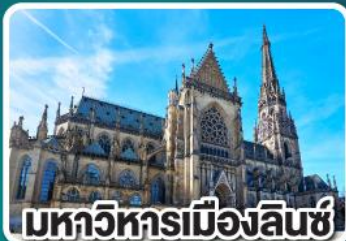
มหาวิหารเมืองลินซ์