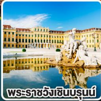
พระราชวังเซินบรุนน์

บินตรงไปกลับ ด้วยสายการบินชั้นนำระดับ 4 ดาว คูปองันซ่าและออสเตรียนแอร์ไลน์