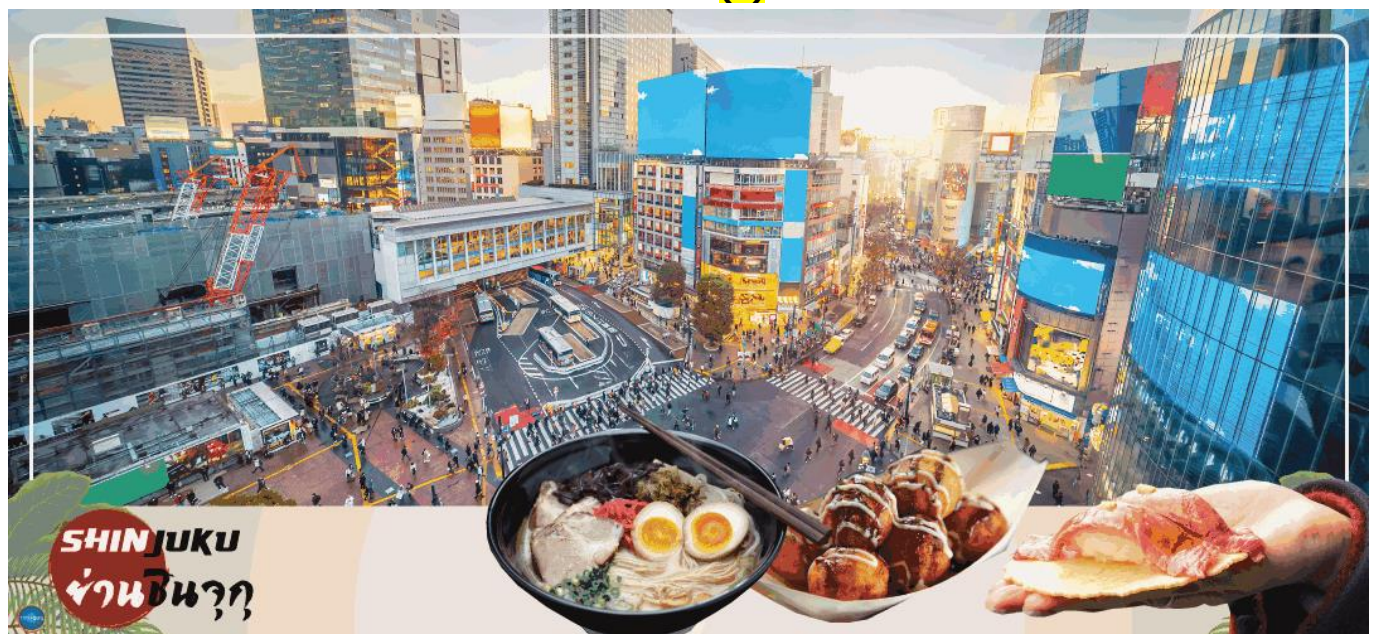
SHINJUKU ย่านชินจูกุ

เที่ยง รับประทานอาหารกลางวัน ณ ภัตตาคาร (4)