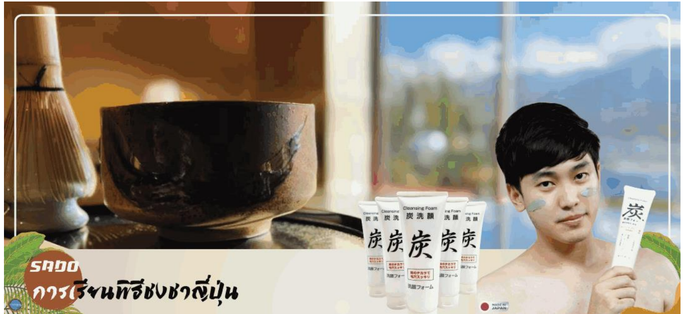
SADO การชงชาพิธีชงชาญี่ปุ่น

วันที่สาม เมืองยามานาชิ – พิธีชงชาญี่ปุ่น – กรุงโตเกียว – ชมแมวยักษ์ 3 มิติ พร้อมช้อปปิ้งย่านชินจูกุ – ย่านโอไดบะ – ห้างไดเวอร์ซิตี –เมืองนาริตะ