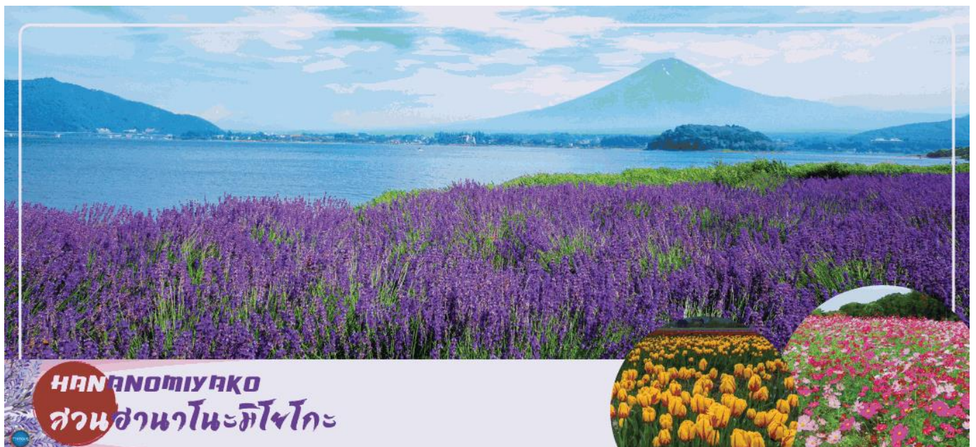
HANANOMIYAKO สวนसानะโนะมิยาโกะ

08.00 น. เดินทางถึง ท่าอากาศยานนานาชาตินาริตะ ประเทศญี่ปุ่น นำท่านผ่านขั้นตอนการตรวจคนเข้าเมืองและศุลกากร เรียบร้อยแล้ว (เวลาที่ญี่ปุ่น เร็วกว่าเมืองไทย 2 ชั่วโมง กรุณาปรับนาฬิกาของท่านเพื่อความสะดวกในการนัดหมายเวลา) ***สำคัญมาก!! ประเทศญี่ปุ่นไม่อนุญาตให้นำอาหารสด จำพวก เนื้อสัตว์ พืช ผัก ผลไม้ เข้าประเทศ หากฝ่าฝืนมีโทษปรับและจับ