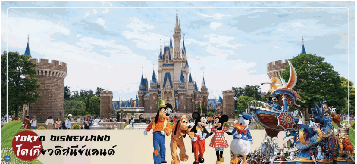
TOKYO DISNEYLAND โตเกียวดิสนีย์แลนด์