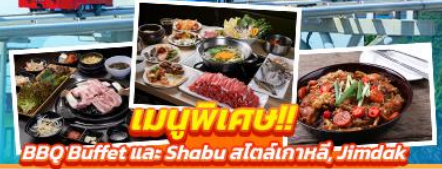
BBQ Buffet และ Shabu สizzling plate, Jimdak