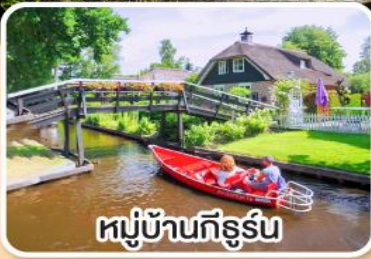
หมู่บ้านทึร์น