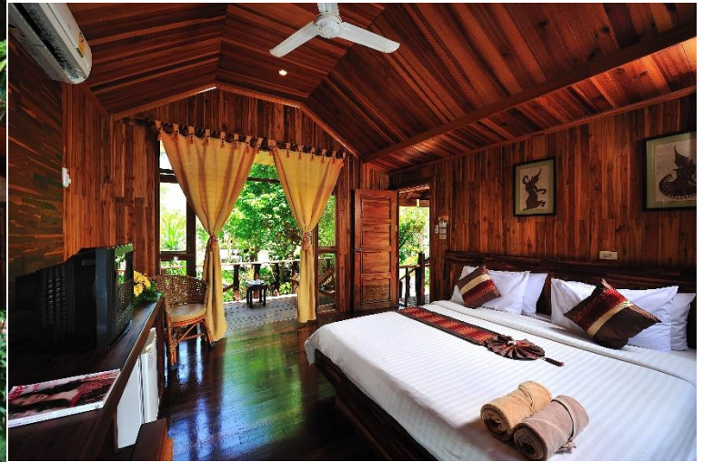
Garden Triple Bungalow