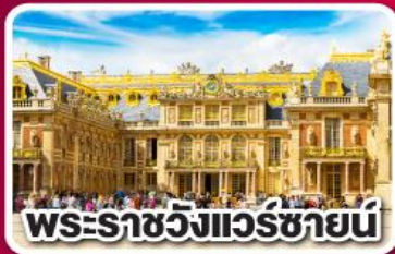
พระราชวังแวร์ซายน์