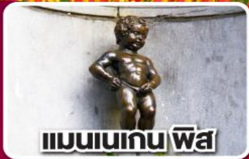
แมนเนเกน พิส