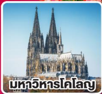
มหาวิหารโคโลญ

เที่ยวเก็บครบ เบนลักซ์ เบลเยียม เนเธอร์แลนด์ และลักเซมเบิร์ก