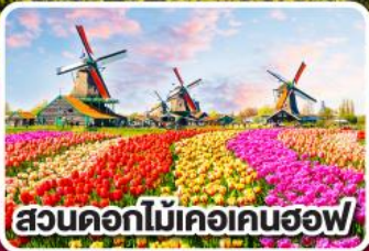
สวนดอกไม้เคอเคนฮอฟ

ดอกไม้ที่สดใส กับ หัวใจที่เปิดบาน ฝรั่งเศส เบลเยียม ลักเซมเบิร์ก เยอรมนี เนเธอร์แลนด์ 8 วัน 6 คืน