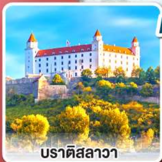
ปราตีสลาวา

เยือนหมู่บ้านกรีนซิง แห่งออสเตรีย พร้อมอาหารค่ำแบบ “ชอยริทท์”และไวน์สด