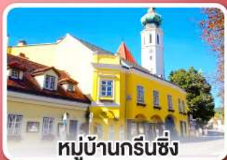
หมู่บ้านกรีนซิง